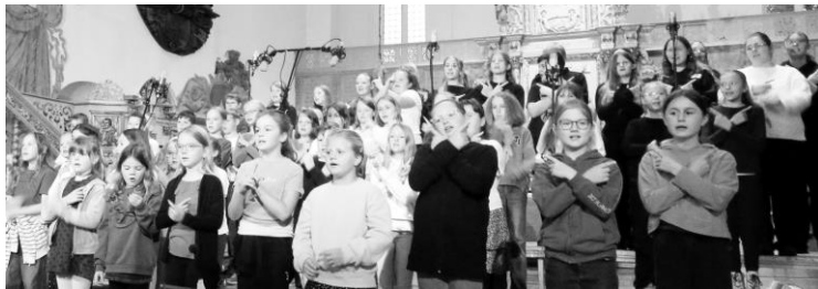
Kinder- und Jugendchor